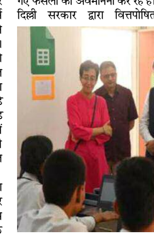
कॉलेजों में गर्वनिंग बोर्डों के बैगैर किसी भी व्यक्ति का अपॉइंटमेंट पूरी तरह गैर-कानूनी है। उपकुलपति के