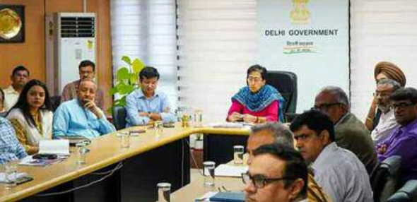
बैठक में बिजली मंत्री को बताया कि, पिछले साल गर्मियों में दिल्ली में बिजली की सर्वाधिक मांग 7695 मेगावाट थी और बिना किसी पावर कट के बिजली विभाग इस अत्यधिक मांग को पूरा करने में सक्षम रही। इस साल पीक पावर डिमांड $100 मेगावाट तक पहुंच सकती है, लेकिन हम आगामी गर्मियों में बढ़ने वाली बिजली की मांग को पूरा करने के लिए तैयार हैं।

सक्षम रही। इस साल पीक पावर डिमांड $100 मेगावाट तक पहुंच सकती है, लेकिन हम आगामी गर्मियों में बढ़ने वाली बिजली की मांग को पूरा करने के लिए तैयार हैं। इस मौके पर उर्जा मंत्री आतिशी ने कहा कि मुख्यमंत्री अरविंद केजरीवाल जी के नेतृत्व में दिल्ली सरकार देश की पहली ऐसी सरकार है जिसने अपने नागरिकों में यह विश्वास पैदा किया है कि उन्हें बिना किसी पावर कट के 24x7 बिजली मिल सकती है और हम आने वाले समय में भी बिजली की मांग बढ़ने के बावजूद लोगों के इस विश्वास को टूटने नहीं देंगे और दिल्लीवासियों को निबंध बिजली मिलती रहे। उर्जा मंत्री ने अधिकारियों को निर्देश दिए कि मांग के अनुसार सभी डिस्कॉम बिजली कंपनियों के साथ अतिरिक्त बिजली टाई-अप कर के रखे। साथ ही उन्होंने निर्देश दिए कि पावर सब-स्टेशनों की मेन्टेनेंस की जाए, जहां जरूरत है सब-स्टेशन को अपग्रेड किया जाए व बिजली की लाइनों और तारों की जरूरी मेन्टेनेंस भी की जाए ताकि पीक टाइम के दौरान किसी प्रकार भी प्रकार की समस्या उत्पन्न न हो।