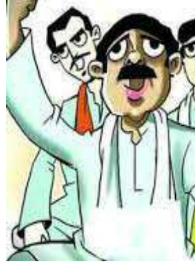
आबादी, 17.5 परसेंट किसान कोटा, 6 प्रतिशत आबादी प्लॉट का प्रावधान खत्म किया जाना और अन्य

समस्याओं की उभेक्षा करने, 10 प्रतिशत आबादी प्लॉट, रोजगार, मुद्दों पर आक्रोश प्रकट किया। किसानों ने बताया कि उन्हें उक्त न्याय न मिलने पर किसानों द्वारा आगे की रणनीति बनाई गई जिसकी शुरुआत किसान दादरी विधायक का घेराव कर शुरू करेंगे। किसानों ने बताया कि प्राधिकरण द्वारा उनका शोषण किया जा रहा है। उन्होंने प्राधिकरण पर जादखिलाफी करने, किसानों की