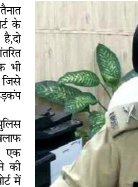
प्रदेश सरकार द्वारा पुलिस आयुक्त द्वारा भेजी गई रिपोर्ट पर गंभीरता से विचार कर कार्रवाई शुरू कर दी गई है। जनपद से अब तक 2 पुलिस अधिकारियों को स्थानांतरित कर दिया गया है और बाकी के बारे में भी जल्द ही आदेश आने की संभावना है।

कई निरीक्षक, उपनिरीक्षक और कई अन्य अधिकारी व कर्मचारी शामिल हैं। जिनके बारे में लिखा गया है कि यहाँ पर अपराधियों से सांठगाठ कर अपराधी तत्वों को बढ़ावा दे रहे हैं और पुलिस की गोपनीयता को भंग कर रहे हैं, कुछ पर अपराधियों के साथ सीधी सांठगाठ के आरोप हैं तो कुछ पर गोपनीय सूचनाएं लीक करने के आरोप हैं। प्रदेश सरकार द्वारा पुलिस आयुक्त द्वारा भेजी गई रिपोर्ट पर गंभीरता से विचार कर कार्रवाई शुरू कर दी गई है। जनपद से अब तक 2 पुलिस अधिकारियों को स्थानांतरित कर दिया गया है और बाकी के बारे में भी